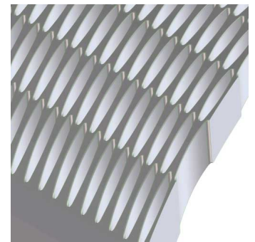
Per ECM können die Löcher auch schräg in gekrümmte Flächen eingebracht werden, was bei spanender Fertigung immer zu Problemen führt

ECM – electrochemical machining – ist ein abbildend abtragendes Verfahren. Werkzeug und Werkstück liegen als Elektroden hier am positiven und negativen Pol einer Gleichstromquelle mit 8 bis 20 Volt Spannung. Tool und Teil haben zwischen 0,05 und 2 mm Abstand. Durch diesen Spalt strömt eine