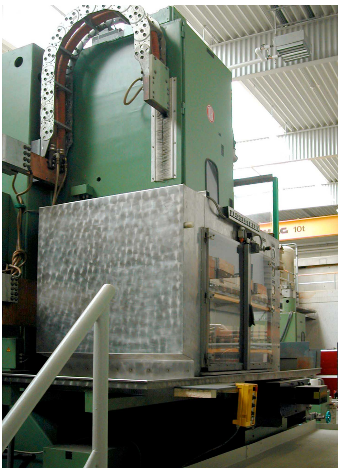
ECM-Anlagen bearbeiten Werkstücke zwischen 20 g bis 4000 kg Masse komplett und einbaufertig

Maschinenfabrik Köppern GmbH & Co. KG Tel. 0 23 24 / 20 72 64 Fax 0 23 24 / 20 72 05 www.koeppern.de